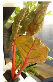
スイスチャード赤